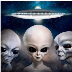
"טוביך שהמגע הראשון ייווצר עם 'האפורים', יצורים שהם הכי קרובים לנו"

"יש אלפי כוכבים עם תנאים דומים מספיק לשלנו, ומדענים רציניים זיהו ומיעדו עשרות צורות חיים – למרות שהמינסטרים לא מקבל את זה. הכי קרובים אלינו הם מה שאנחנו קוראים 'האפורים', שהם יצורים אפורים עם עיניים גדולות כמו שראינו אצל ספילברג, וסביר שהמגע ייווצר איתם".