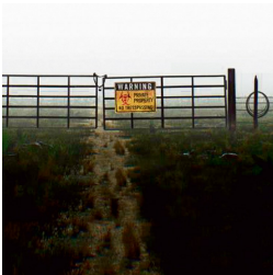
חוות סקינקווקר ביטסה. "תופעות לא נורמליות"

"אתה רואה את הקרינה קופצת, ואתה רואה איך מגיע גוף משנה־צורה, יוצא ממנו אור בתדר שאתה לא יכול לראות בעין בלתי מזוינת – למעשה אתה לא רואה כלום כשאתה מסתכל רגיל – אבל במצלמות, בתדרים הגבוהים, אתה רואה את הגוף הזה במצב 'קטל מיוטיליזשן' – שואב דם מתוך הבקר על הקרקע מול העיניים שלך".