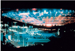
"מכנשים מהסוג השלישי"

פרופ' אשד הוא אחד מאנשי החלל והחוקרים המוערכים והחדים בישראל, מי שעמד בראש מינהלת סוכנות החלל הישראלית במשרד הביטחון והיה אחראי ישיר לתכנון ופיתוח תוכנית הלוויינים של ישראל ולשיגור הלוויין הראשון, "אופק 1", בשנת 1988, עם המשגר "שביט" שפותח במיוחד. בהמשך היה מעורב גם בהמצאת ופיתוח המג"טים והמג"טים הישראליים. והוא היסטוריה, רובה חשאת.