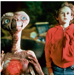
"בהתחלה הם ישלחו רובוטים כאלה, פרימיטיביים מבחינתם, ואז מסר שבצטרך לפענח". מתוך הסרט "א.י.י."

"החללית הגדולה היא כמעט בגודל של עיר קטנה. יוצאות ממנה חלליות קטנות – רובן רובוטיות, מאוישות על ידי רובוטים תבוניים. בהתחלה הם ישלחו רובוטים כאלה, פרימיטיביים מבחינתם, ואז מסר שבצטרך לפענח".