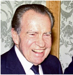
ניקסון. 'גופות של חוצצים'

"גם נשיאים אמריקאים העידו על זה. טרומן הודה שראה קבוצה שלמה של חוצצים מעל וושינגטון. ניקסון, שהיה חבר של הקומיקאי ג'קי גליסון יודע שהוא משוגע לעב"מים, אמר לו: 'אני הולך להגשים את חלום חייך', ולקח אותו לבסיס ווייט־פרסטון והראה לו גופות של חוצצים. גליסון כנעם לדיכאון מזה. הנבדה של אייזנהאואר מעידה שסבא שלה חתם עם החוצצים הסכם, שיהיה להם פה בסיס נחיתה סודי. אנשים מזומצם, לערוך ביסויים, והתכאי הוא שהם יסיפקו לנו טכנולוגיות – למשל אנטי־גראוויטי (טכנולוגיה היפותטית שמאפשרת למקום או לאבייקט להתנתק מכוח הכבידה – ר"ש)".